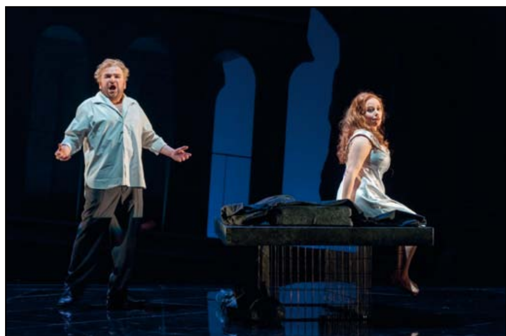
Oper Leipzig, Szene aus Siegfried, 3. Aufzug

09.–12.02.2018 25 Jahre Richard-Wagner-Verband Toulouse/Midi-Pyrénées Toulouse mit Die Walküre , Henri de Toulouse-Lautrec und Carcassonne