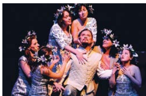
Oper Chemnitz, Szene aus Parsifal, 2. Aufzug

30.03.2018 Parsifal Bühnenweihfestspiel von Richard Wagner