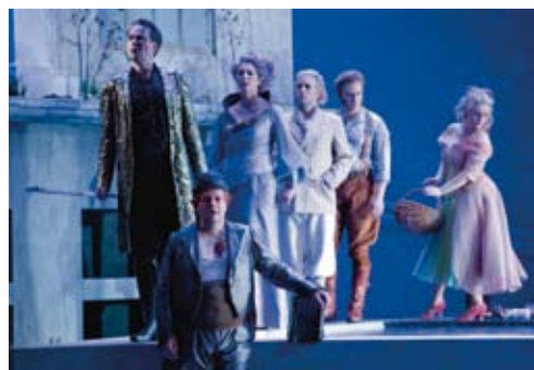
Das Rheingold, Oper Leipzig

30.03., 22.04., 12.05., 17.05., 30.05., 10.06.2019 Der fliegende Holländer Romantische Oper in drei Aufzügen Musikalische Leitung: Ulf Schirmer, Christoph Gedschold Inszenierung: Michiel Dijkema