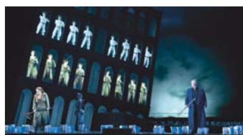
Die Walküre, Oper Leipzig

07.04. und 02.05.2019 Die Walküre Erster Tag des Bühnenfestspiels »Der Ring des Nibelungen« Musikalische Leitung: Ulf Schirmer Inszenierung: Rosamund Gilmore