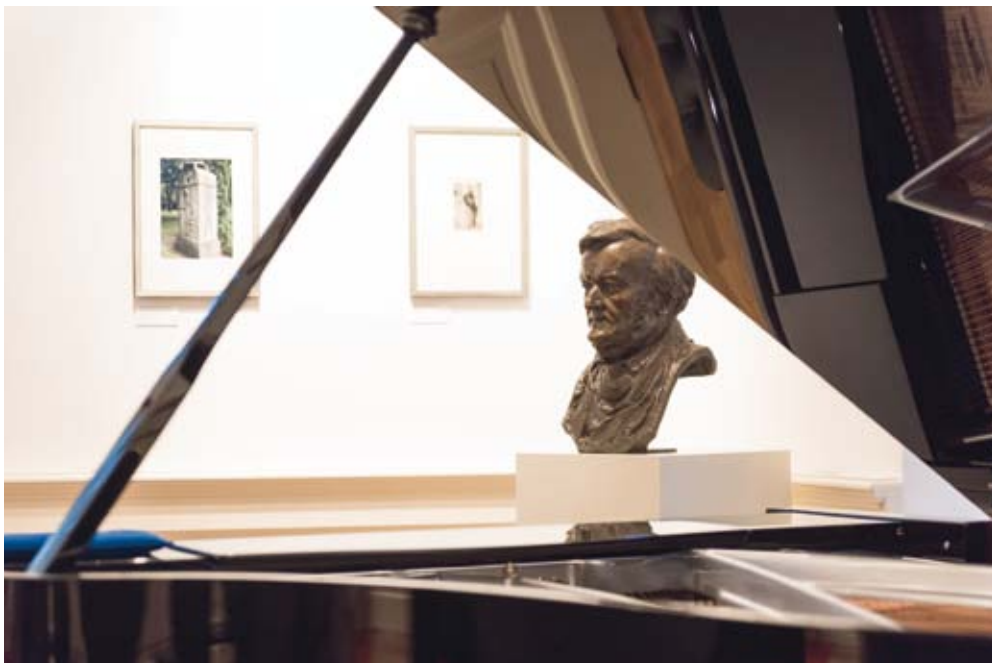
Blick in den Musiksalon der Klinger-Villa

10.02.2019, So – 15:00 bis 18:00 Uhr (Einlass ab 14.30 Uhr) Alte Nikolaischule, Richard-Wagner-Aula, Nikolaikirchhof 2, 04109 Leipzig Veranstalter: Richard-Wagner-Verband Leipzig, Kulturstiftung Leipzig und Initiative Leipziger Notenspur Notenspursalon »Richard Wagner« Eintritt: 15 € / ermäßigt: 10 € Informationen und Karten in der Geschäftsstelle des Verbandes und in der Musikalienhandlung Oelsner, Schillerstr. 5, 04109 Leipzig