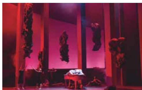
Götterdämmerung, Oper Leipzig

13.04. und 04.05.2019 Siegfried Zweiter Tag des Bühnenfestspiels »Der Ring des Nibelungen« Musikalische Leitung: Ulf Schirmer Inszenierung: Rosamund Gilmore