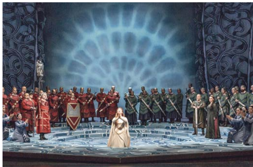
Lohengrin, Nationaltheater Prag