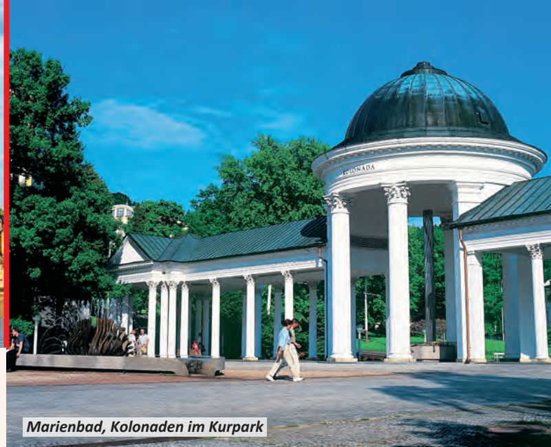
Marienbad, Kolonaden im Kurpark