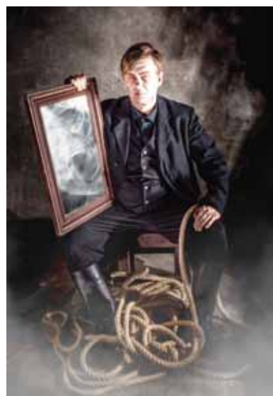
Der fliegende Holländer, Nordharzer Städtebundtheater, Halberstadt

28.11. – 02.12.2019 Venedig – Zum Internationalen Richard-Wagner-Kongress Informationen und Anmeldung: RAIFFEISEN- und VOLKSBANKEN TOURISTIK – Susann Krause, Tel.: 0341 96 27 91 13 s.krause@rv-touristik.de