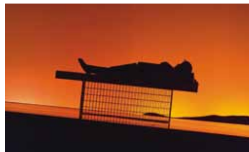
Siegfried, Oper Leipzig