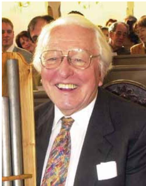
Wolfgang Wagner (1919–2010), Enkel Richard Wagners, in der Kirche Müglitz, Herbst 2001