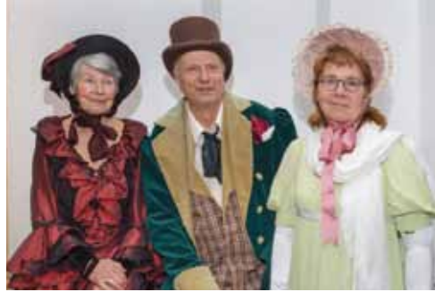
Notenspursalon am 10. Februar 2019 in der Alten Nikolaischule

23.02.2020, So – 15:00 Uhr Alte Handelsbörse, Naschmarkt, 04109 Leipzig Einlass ab 14 Uhr Notenspursalon »Richard Wagner« Eintritt: 15 €; Verbandsmitglieder, Schüler, Studenten 12 € Informationen und Karten in der Geschäftsstelle und der Musikalienhandlung Oelsner, Schillerstraße 5, 04109 Leipzig