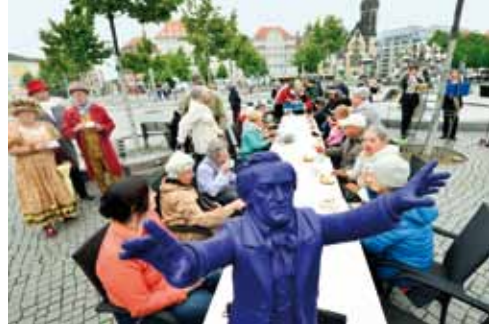
Traditionelle Kaffeetafel zum Geburtstag Richard Wagners auf dem Richard-Wagner-Platz, 22. Mai 2019

22.05.2020, Fr – 14:00 Uhr Richard-Wagner-Platz, 04109 Leipzig »Happy Birthday – Richard!« Öffentliche Geburtstagstafel zum 207. Geburtstag von Richard Wagner Eröffnung an der Gedenktafel am ehemaligen Geburtshaus, Brühl 3