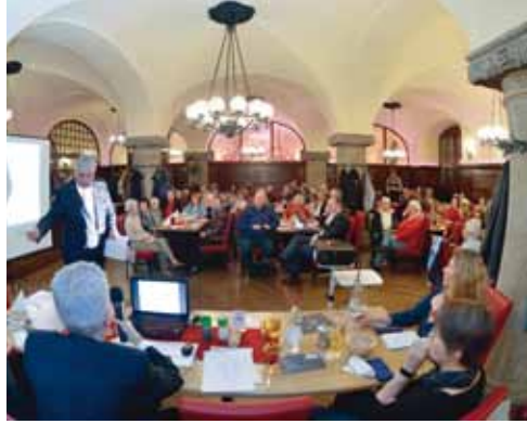
Mitgliederversammlung im Ratskeller am 26. Februar 2019

26.02.2020, Mi – 18:00 Uhr Neues Rathaus, Ratskeller, Lotterstraße 1, 04109 Leipzig Jahreshaupt- und Mitgliederversammlung Nicht öffentlich, nur für Mitglieder des Richard-Wagner-Verbandes Leipzig