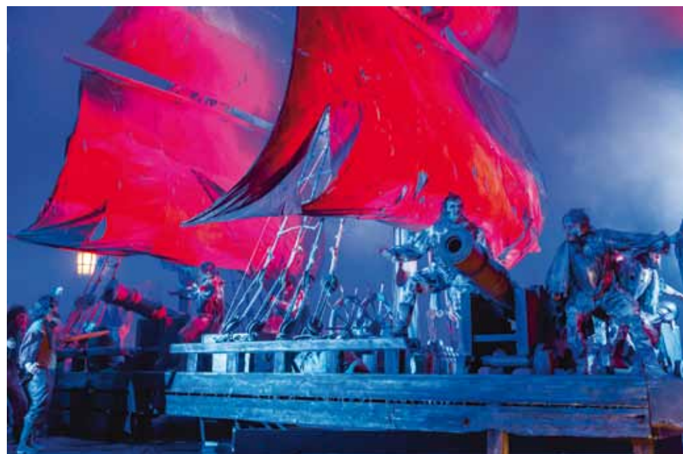
Der fliegende Holländer, Oper Leipzig

09.11.2019, Tagesfahrt Abfahrt 08.30 Uhr, Leipzig Hbf., Bahnsteig 2-5, Abfahrtsstelle Bus Polster & Pohl Reisen Mit Richard Wagner ins Land der Askanier Neo Rauch in Aschersleben und »Der fliegende Holländer« in Halberstadt Preis: 68,50 € für Verbandsmitglieder, 88,50 € für Nichtmitglieder Reservierung und Buchung: Polster & Pohl Reisen – Franziska Poetzsch, Tel.: 0341 26 17 325, f.poetzsch@polster-pohl.de