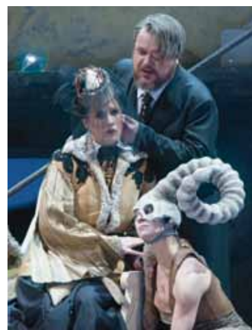
Die Walküre, Oper Leipzig

16.01.2020, 21.05.2020 Die Walküre Erster Tag des Bühnenfestspiels »Der Ring des Nibelungen« Musikalische Leitung: Ulf Schirmer Inszenierung: Rosamund Gilmore